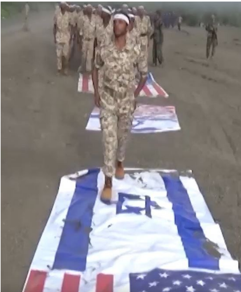
Рис. Б.6 Кейс «Випускний у Йемені».