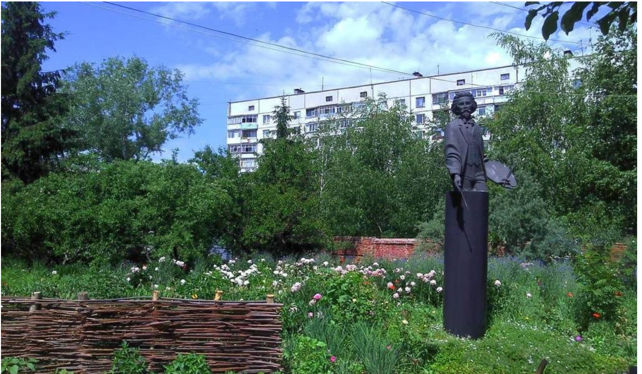
Рис. В.3.5 Кейс «Чугуїв» – шостий ракурс.