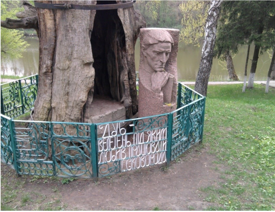
Рис. В.2 Кейс «Сковородинівка» – перший ракурс.