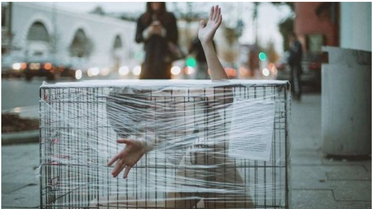
Рис. Б.1.1 Кейс «Вантаж 300» – второй ракурс.