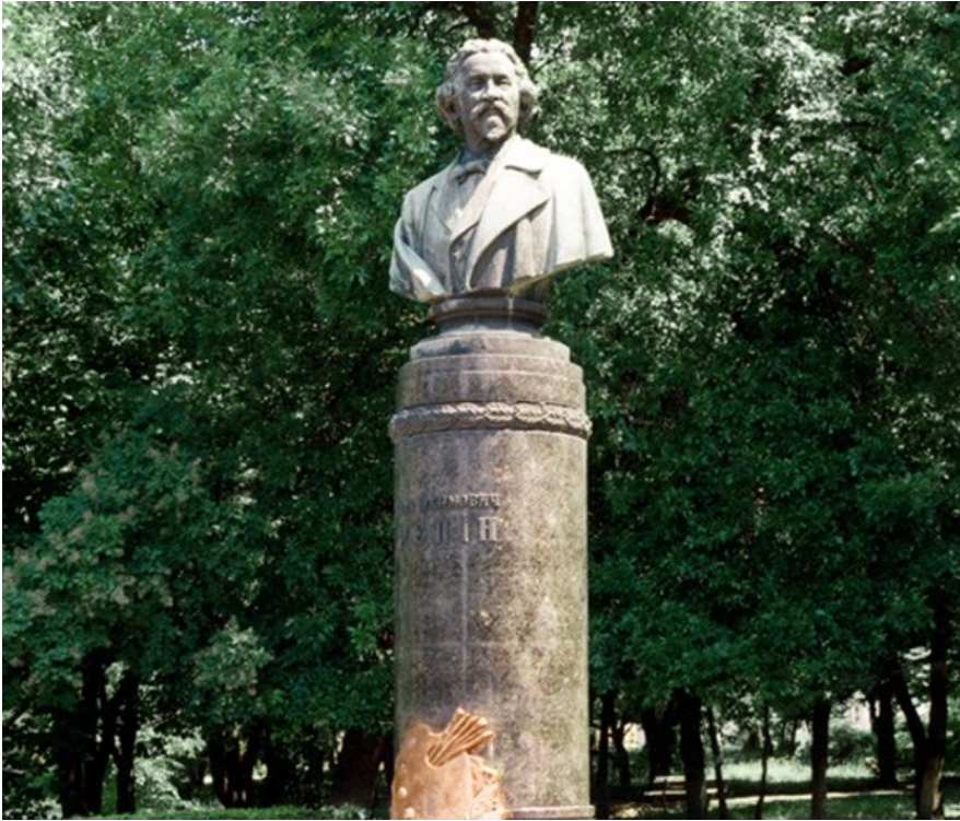
Рис. В.3.4 Кейс «Чугуїв» – п'ятий ракурс.