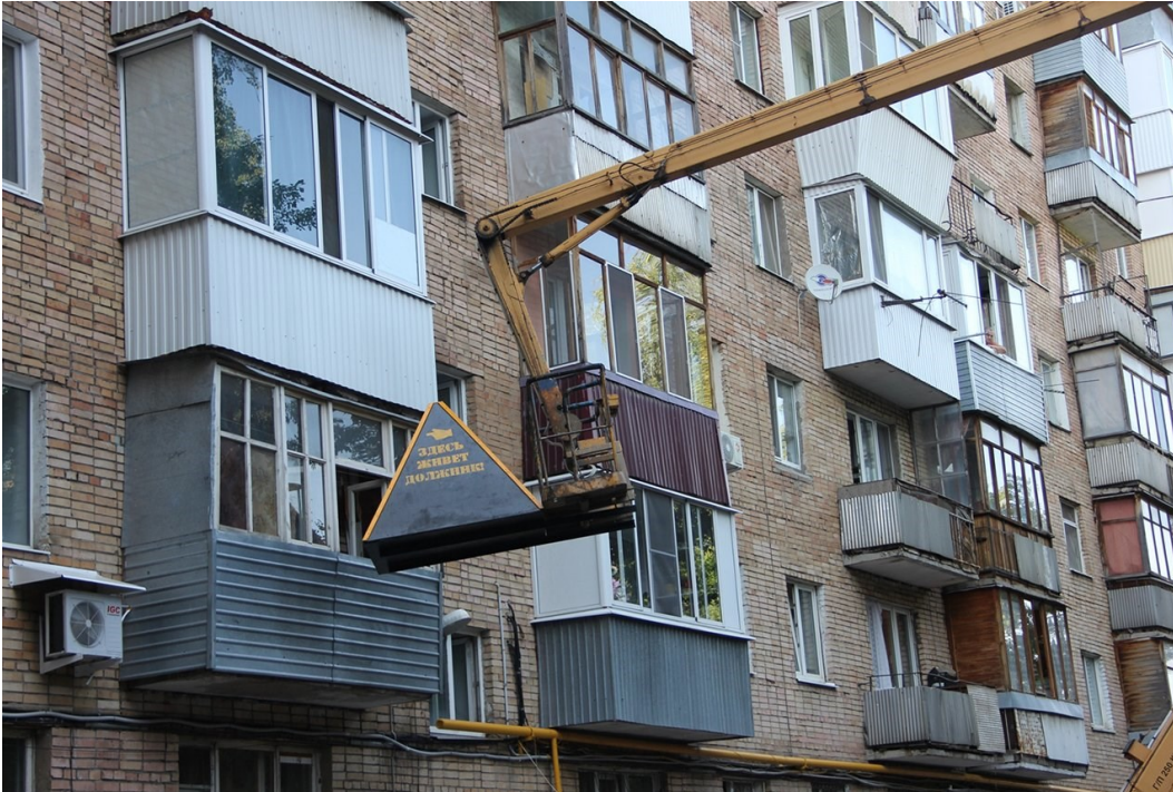
Рис. В.4.1 Кейс «Пираміда ганьби» – другий ракурс.