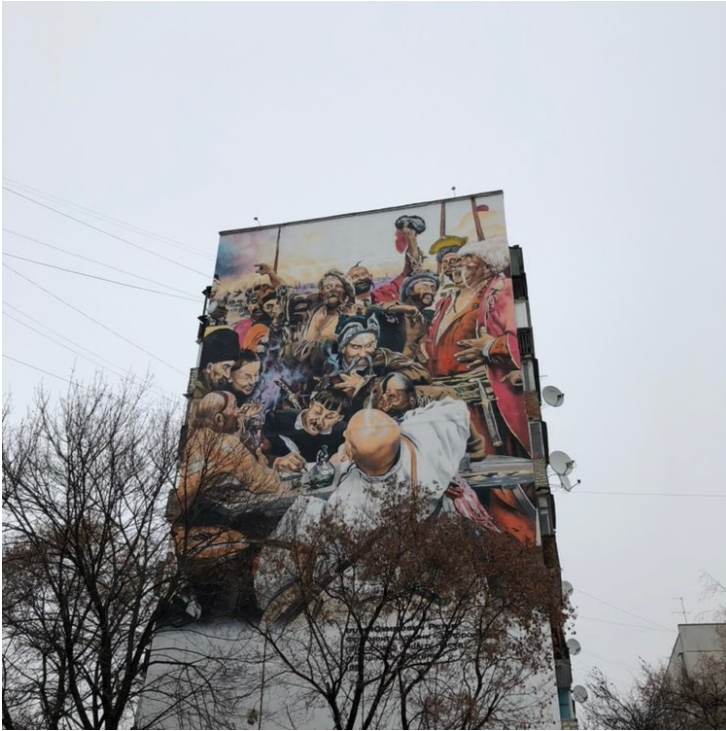
Рис. В.3.6 Кейс «Чугуїв» – сьомий ракурс.