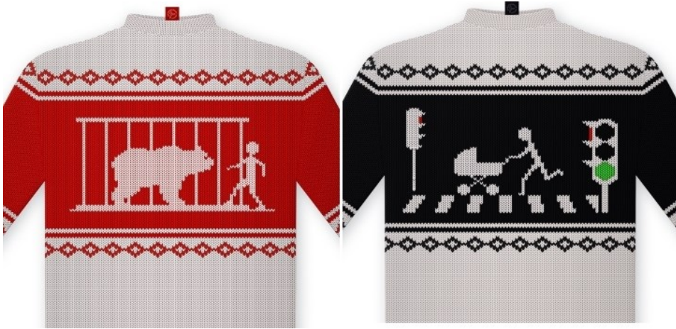
Рис. Б.8.2 Кейс «Светр з оленями» – третій та четвертий варіанти.