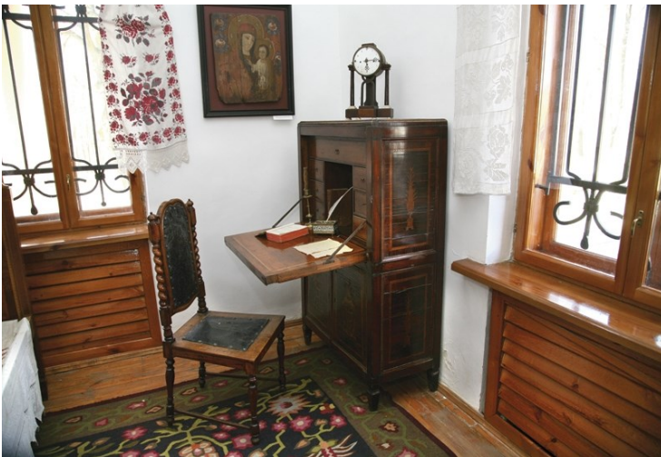
Рис. В.2.1 Кейс «Сковородинівка» – другий ракурс.