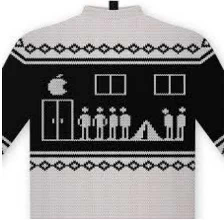
Рис. Б.8.1 Кейс «Светр з оленями» – другий варіант.