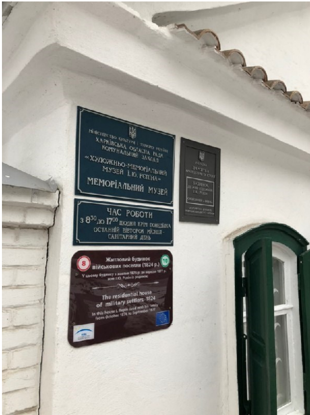
Рис. В.3 Кейс «Чугуїв» – перший ракурс.