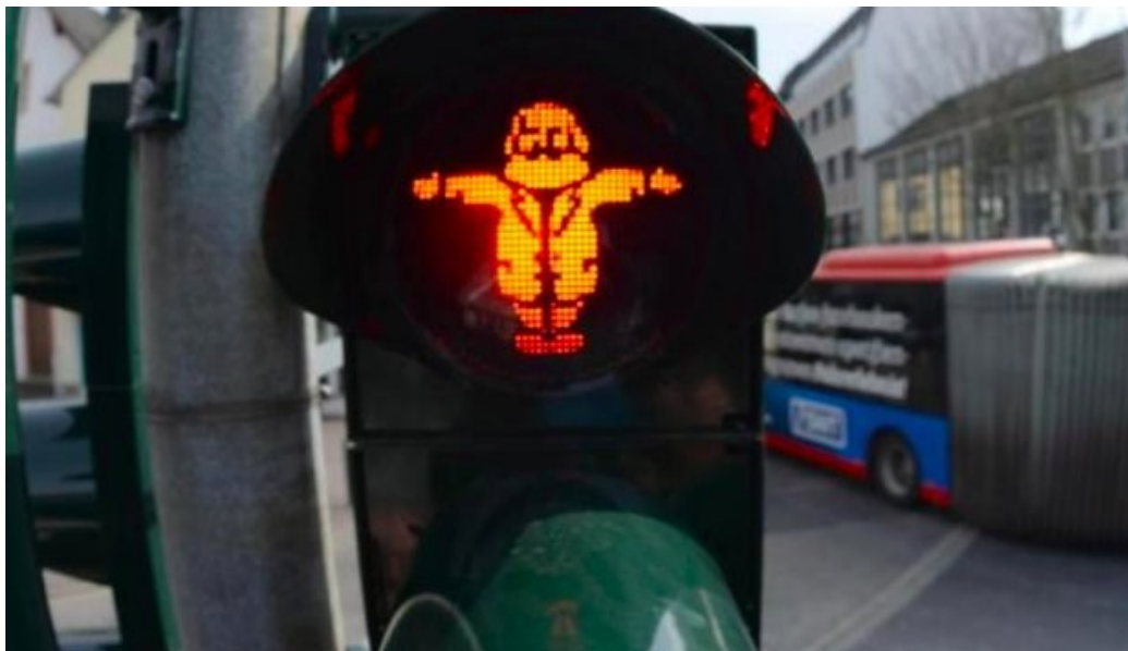
Рис. В.1 Кейс «Трір».