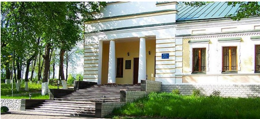
Рис. В.2.2 Кейс «Сковородинівка» – третій ракурс.