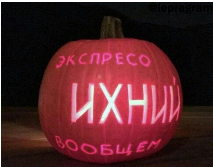
Рис. Б.9 Кейс «Гарбузи» – перший варіант.