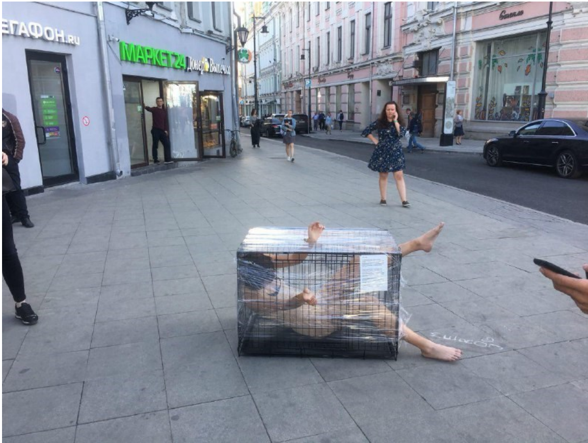
Рис. Б.1 Кейс «Вантаж 300» – первый ракурс.