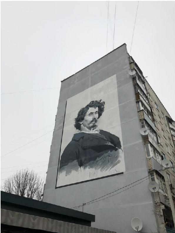
Рис. В.3.7 Кейс «Чугуїв» – восьмий ракурс.