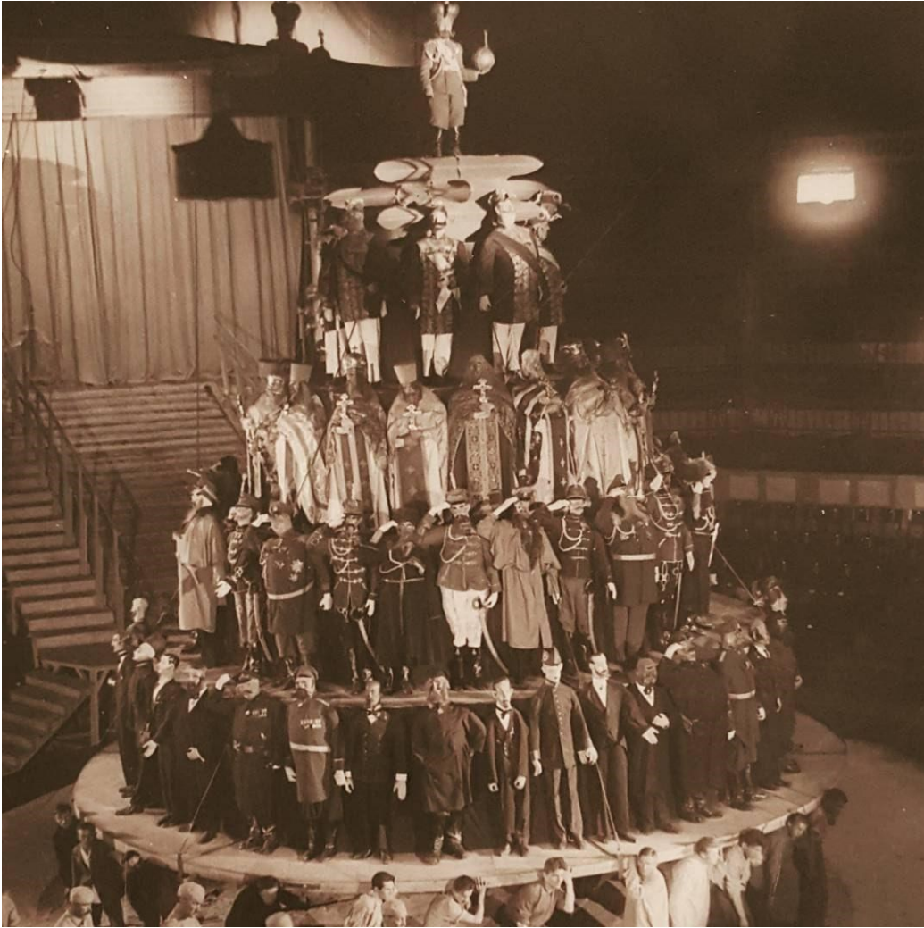
Рис. Б.2 Кейс «Класова піраміда».