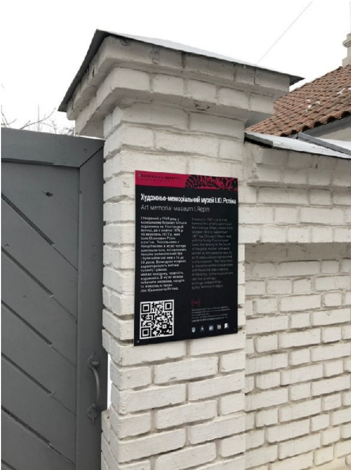
Рис. В.3.3 Кейс «Чугуїв» – четвертий ракурс.