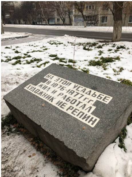
Рис. В.3.1 Кейс «Чугуїв» – другий ракурс.