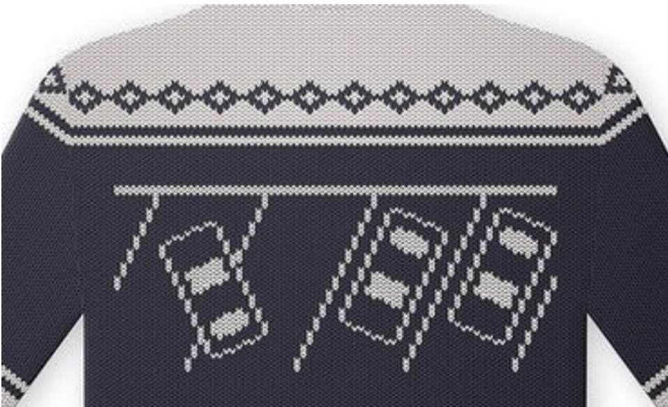
Рис. Б.8 Кейс «Светр з оленями» – перший варіант.