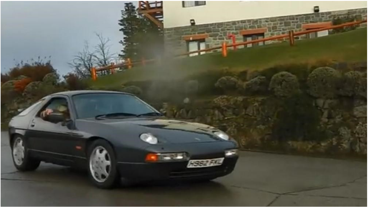
Рис. Б.5 Кейс «Провокаційний номерний знак».