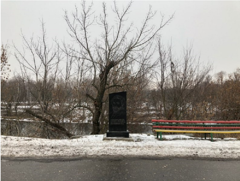
Рис. В.3.2 Кейс «Чугуїв» – третій ракурс.