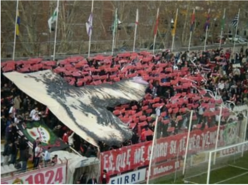
Рис. Б.7 Кейс «Зозуля».