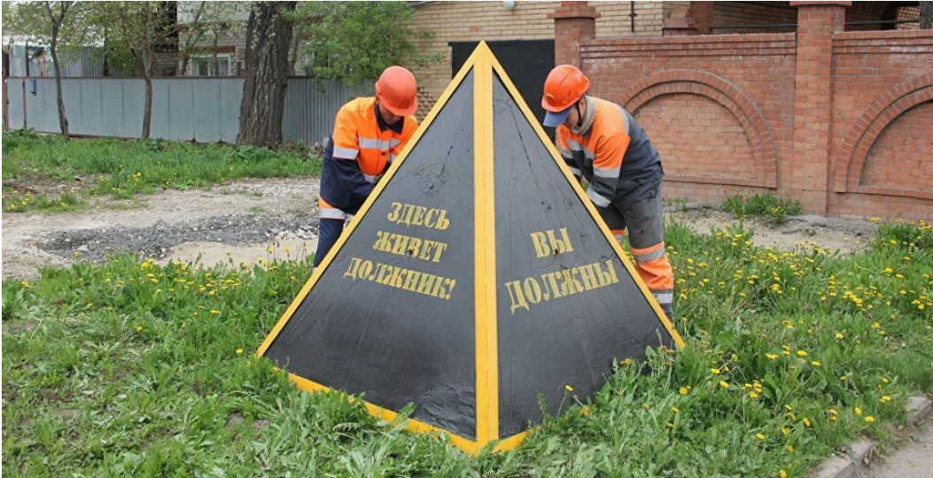
Рис. В.4 Кейс «Пираміда ганьби» – перший ракурс.